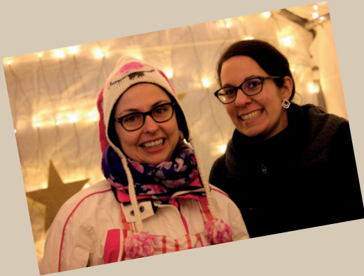
Christkindlmarkt am Bahnübergang, 22.11.19

~~~ aus dem Vereinsleben ~~~ aus dem Vereinsleben ~~~ aus dem Verei